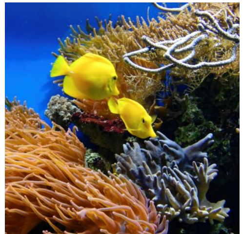
Unterwasserwelt, Mamanuca Inseln

Heute werden Sie Ihr erstes Hotel verlassen und weiter Richtung Pacific Harbour fahren. (F)