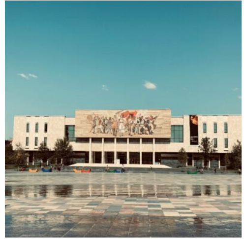
Skanderbeg Platz in Tirana

Ihre heutige Tour beginnt mit dem Besuch des Diviaka-Nationalparks, direkt am Adriatischen Meer gelegen. Dalmatinischen Pelikane und vielen anderen Vogelarten sind hier zu finden. Auf einer kleinen Wanderung flanieren wir im durch die flache Lagunenlandschaft. Weiterfahrt nach Berat, UNESCO-Weltkulturerbe. Die Stadt ist bekannt für seine markante osmanische Architektur und seine einzigartigen Reihenhäuser und wird auch die "Stadt der tausend Fenster" genannt. Mit über 2.400 Jahren anhaltender Besiedlungshistorie gilt sie als eine der ältesten Städte Albaniens. Sie besichtigen die malerische Altstadt zu Fuß. Die drei wichtigsten Viertel der Altstadt sind Mangalemi, Gorica und Kala, wo sich das Schloss selbst befindet. Der Besuch der "Kala" erfordert einen steilen Spaziergang auf einem gepflasterten Weg, aber diejenigen, die es bis an die Spitze schaffen, werden mit einem schönen Ausblick auf die Umgebung belohnt. Sie besichtigen das Museum der Ikonographie "Onufri", das den Namen des berühmten Freskos und Ikonenmalers Onufri trägt, der ein reiches Erbe hinterlassen hat. Bei der Besichtigung des Mangalemi Viertels machen wir eine Pause mit erfrischendem Joghurt mit Honig und Walnüssen, einer Spezialität Albaniens. Die Bogenbrücke von Gorica aus dem Jahre 1780 ist ein schönes Baudenkmal, das zwischen Gorica und Mangalemi errichtet wurde. Freizeit zum Bummeln und Rückfahrt zum Hotel. (F A)