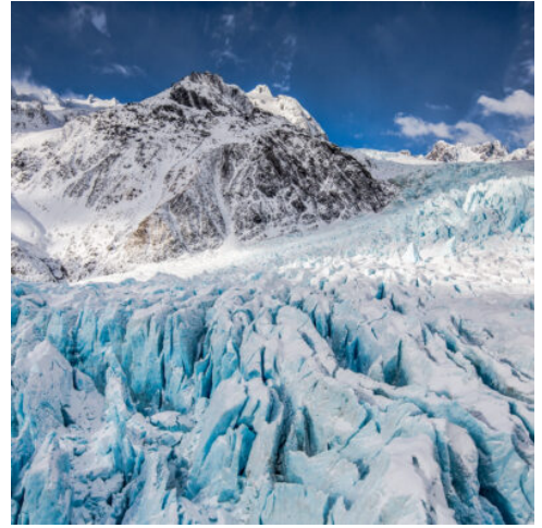
Franz Josef Gletscher

Am Vormittag bekommen Sie bei einer Stadtrundfahrt historische Sehenswürdigkeiten zu sehen. Der Nachmittag steht zur freien Verfügung. Wer sich dem optionalen Ausflug nach Philipp Island anschließt, erlebt dort die berühmte Penguin Parade (optional zubuchbar). (F)