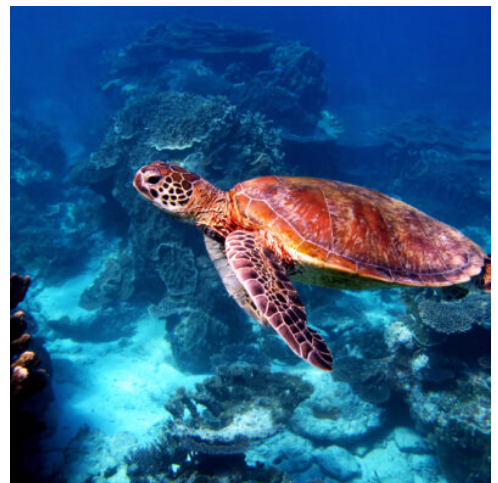
Great Barrier Reef

Heute erwartet Sie ein unvergessliches Abenteuer in der faszinierenden Unterwasserwelt des Great Barrier Reefs. Mit einem Ausflugsschiff werden Sie weit hinaus zum Outer Reef gebracht, wo Sie auf farbenfrohe Korallenbänke und eine aufregende Meeresfauna treffen. Tauchen Sie ein in diese märchenhafte Unterwasserwelt und erleben Sie sie hautnah beim Schwimmen, Schnorcheln oder Tauchen (gegen Gebühr). (F M)