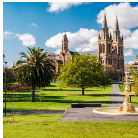
St. Peter's Cathedral in Adelaide

Die „Devils Marbles“, riesigen Granitkugeln mitten in der Wüste verblüffen als monströses Kunstwerk der Natur. Weiter geht es nach Alice Springs. Machen Sie sich hier mit der Historie der alten Telegrafstation vertraut. (F A)