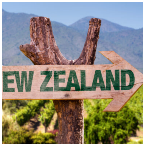
Willkommen in Neuseeland

Auf dem Weg nach Mount Gambier liegt die Weinregion von Coonawarra, bekannt für exzellente Cabernet Sauvignons. Mount Gambier ist an den Hängen eines erloschenen Vulkanes erbaut, den Krater füllt ein See. (F A)