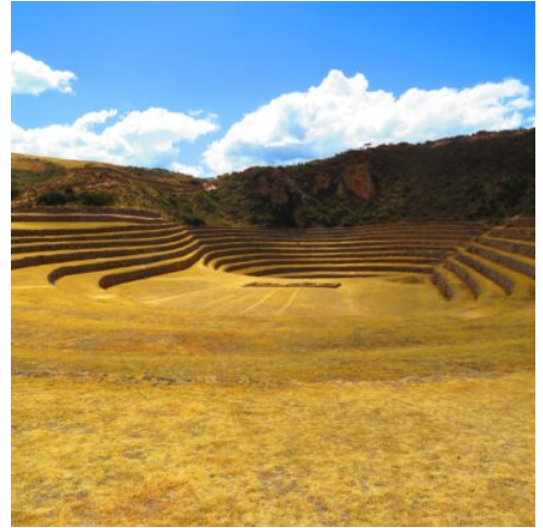
Inka-Terrassen von Moray

Nehmen Sie Abschied von Peru. Lassen Sie die letzten Tage bei einem gemütlichen Spaziergang durch den Park von Miraflores Revue passieren, ehe Sie mit vielen neuen Eindrücken im Gepäck Ihren Rückflug nach Deutschland antreten.