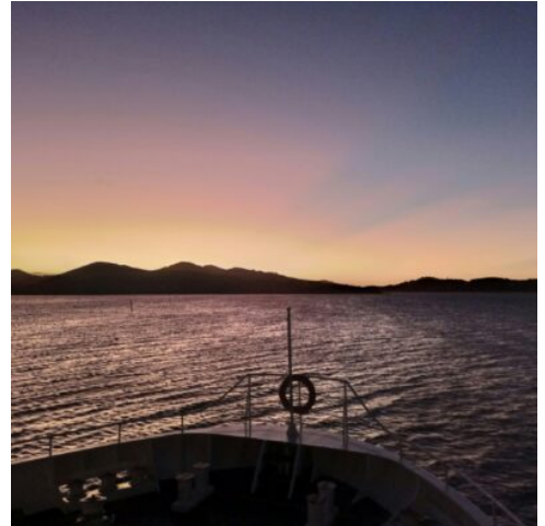
Sonnenuntergang vor Viti Levu

Verbringen Sie den Tag auf dem Blue Lagoon Kreuzfahrtschiff und genießen Sie die spektakuläre Schönheit der Yasawa-Inseln. Das heutige Ziel ist die berühmte Blaue Lagune, mit herrlich türkisem Wasser und wunderschönen Korallenriffen. Auf der Insel Nanuya Lailai befindet sich der Privatstrand von Blue Lagoon Cruises, wo die Crew das Schiff direkt am Strand positioniert. Genießen Sie das Mittagessen an Bord und entspannen Sie sich auf dem privaten „Fiji Style Beach Club“ mit Sonnenliegen, Massagen, einer Bar und Beachvolleyball. Sie haben viel Zeit zum Schwimmen, Schnorcheln, Fische füttern und dürfen Korallen vom Glasbodenboot aus beobachten. Lernen Sie, wie man Palmen erklimmt, Kokosnüsse erntet und öffnet, und genießen Sie frische Kokosnussmilch. Tauchen und geführte Schnorchelausflüge sind ebenfalls möglich. Genießen Sie diesen Tag im Paradies und nehmen Sie Erinnerungen und Fotos von diesem wunderschönen Ort mit nach Hause. (F M A)