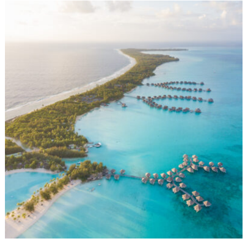
Lagune von Bora Bora

Heute werden Sie von Ihrem Hotel zum Domestic Airport gebracht und fliegen zurück nach Tahiti. Nach Ankunft werden Sie zu Ihrem Hotel gebracht. (F)