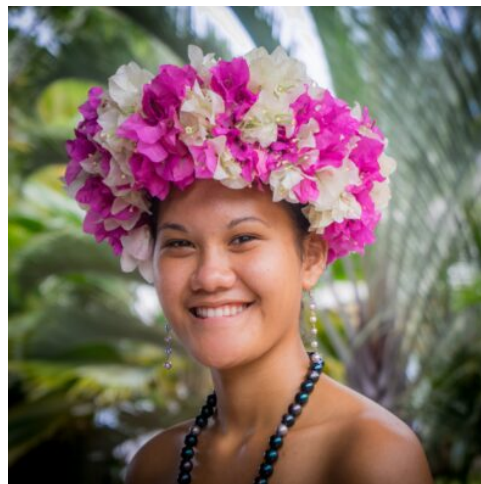
Mädchen mit Blumenkranz

Heute werden Sie von Ihrem Hotel abgeholt und zum Domestic Airport gebracht, von wo aus es zurück nach Tahiti geht. Ein Transfer bringt Sie zu Ihrer Unterkunft auf Tahiti. (F)