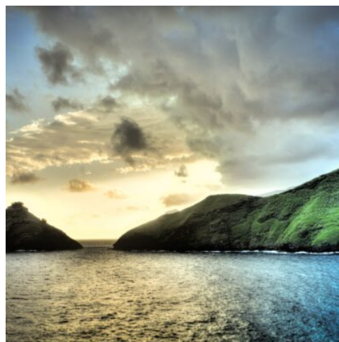
Nuva Hiva Insel

Nun heißt es Abschied nehmen. Ihr Transfer bringt Sie zum internationalen Flughafen von Papeete, von wo aus Ihr Heimflug nach Deutschland startet. (F)