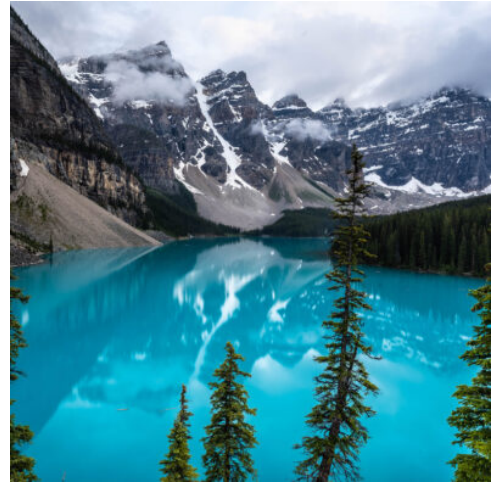
Moränensee im Banff-Nationalpark in Alberta, Kanada

Am riesigen Columbia Icefield bietet sich Ihnen die Gelegenheit, optional eine Tour mit dem „SnoCoach“ (Schneemobil) über die glitzernden Eismassen des Athabasca Gletschers zu unternehmen, eine Erfahrung, die Sie so schnell nicht vergessen werden. Nach einem Zwischenstopp an den beeindruckenden Athabasca Wasserfällen erreichen Sie schließlich Jasper. Hier erhalten Sie bei einer kurzen Orientierungsfahrt einen ersten Überblick über diesen bezaubernden Ort. (F)