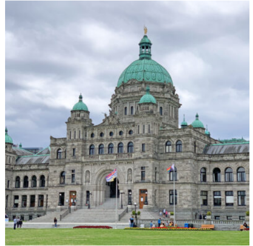
Das Regierungsgebäude in Victoria auf Vancouver Island

In Banff werden Sie von der malerischen Schönheit des Ortes empfangen. Sie haben Gelegenheit, das legendäre Banff Springs Hotel zu bewundern, das im Stil eines schottischen Schlosses erbaut wurde. Mit etwas Glück können Sie sogar eine Herde Wapitis bei einem „Stadtbummel“ beobachten, wie sie in der Umgebung unterwegs sind. Ein weiteres Highlight ist die Fahrt mit der Gondel auf den Sulphur Mountain, von wo aus Sie einen atemberaubenden Blick auf Banff und die umliegenden Berge genießen können. Der restliche Tag steht Ihnen zur freien Verfügung, um eigene Erkundungen zu unternehmen. (F)