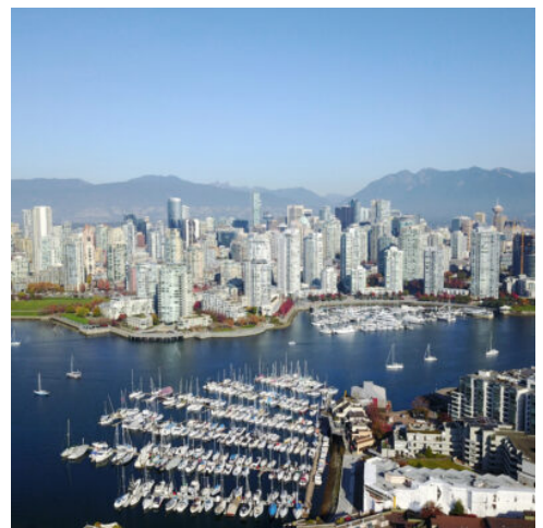
Wolkenkratzer in Vancouver, Kanada

Von Tsawwassen aus nehmen Sie die BC-Fähre, um nach Vancouver Island überzusetzen. Während dieser Fährüberfahrt haben Sie die Möglichkeit, mit etwas Glück Wale, Seelöwen und Weißkopfseeadler zu beobachten, die die Gewässer vor Vancouver Island bewohnen. Nach Ihrer Ankunft auf Vancouver Island fahren Sie weiter zu Ihrem Hotel in Victoria, der charmanten Hauptstadt von British Columbia, die von britischem Flair geprägt ist. (F)