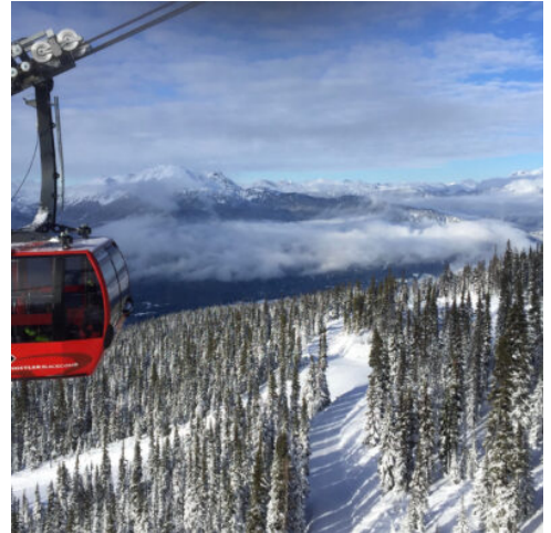
Peak-2-Peak Gondola in Whistler

Im Anschluss nehmen Sie Abschied von Victoria. Per Fähre geht es zurück aufs Festland. Vancouver heißt Sie willkommen. Am Nachmittag erleben Sie bei einer Rundfahrt die Höhepunkte der facettenreichen Metropole: Stanley Park mit seinen indianischen Totempfählen, die English Bay, die Altstadt Gastown, die Robson Street, Chinatown und den Queen Elisabeth Park. Allein die grandiose Lage wäre schon genug, um jeden Besucher für die Metropole Westkanadas zu begeistern: Glitzernde Fjorde und tiefgrüne, am Gipfel meist weiß überzuckerte Berge umrahmen Vancouver. (F)