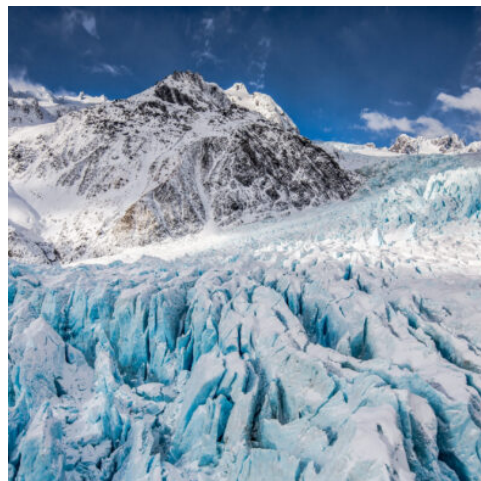
Franz Josef Gletscher

Am Morgen bietet ein Spaziergang um den Lake Matheson Gelegenheit zu einzigartigen Fotomotiven. Die Wanderung zu einem Aussichtspunkt am Franz Josef-Gletscher gewährt einen Blick auf die höchsten Berge der Südalpen und auf den Franz Josef-Gletscher. In Hokitika angekommen, erkunden Sie selbst mit E-Bikes die Seen und die Regenwälder rings um den Lake Mahinapoua. Schlendern Sie im Anschluss noch etwas durch die Stadt und erleben Sie den wunderschönen Sonnenuntergang direkt am Meer. (F)