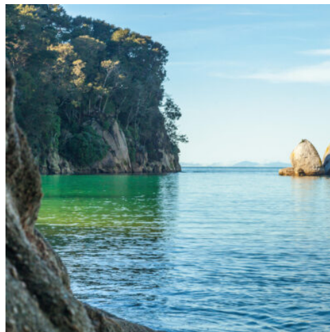
Abel Tasman National Park

Der Abel Tasman-Nationalpark ist der kleinste und zugleich bekannteste Nationalpark des Landes. Ihre Bootsfahrt beginnt am Rande des Parks. Granitfelsen stehen mit goldgelben Stränden im ständigen Wechsel und das Wasser hier ist glasklar. An der Anchorage-Bucht angekommen, unternehmen Sie eine Wanderung und lassen sich ein Picknick-Mittagessen in der herrlichen Landschaft schmecken. Nach der Rückkehr zum Ausgangspunkt rundet eine Weinprobe in der Tasman Region den Tag ab. (F M)