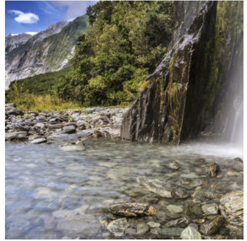
Franz Josef Glacier

Heute erleben Sie eine beeindruckende Fahrt durch die Schlucht des Buller River zur Westküste. Am Cape Foulwind erwartet Sie ein Spaziergang zu einer großen Robbenkolonie. Von hier aus geht es weiter entlang der wilden West Coast in Richtung Süden. In Punakaiki hat die tosende Brandung der Tasmanischen See die berühmten Pancake Rocks aus Kalkstein geformt. Diese Steilfelsen sehen aus wie riesige gestapelte Pfannkuchen und können einen mit spritzigen Wasserfontänen überraschen, wenn man nicht aufpasst. (F A)