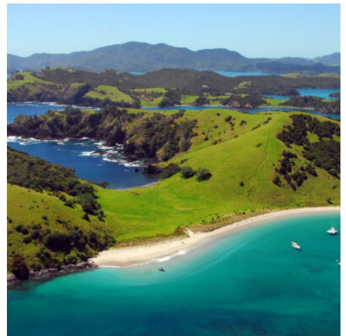
Bay of Islands

Heute starten Sie Ihre Entdeckungsreise in Richtung Norden auf dem malerischen State Highway 1. Unterwegs passieren Sie Whangarei, die Hauptstadt des „winterlosen Nordens“, bevor Sie die subtropische Bay of Islands erreichen. In Paihia erwartet Sie bereits ein Ausflugsschiff, das Sie durch das Insellabyrinth der Bucht führen wird. Erfahren Sie mehr über die koloniale Geschichte Neuseelands, während Sie am Cape Brett vorbeikommen und das berühmte „Hole in the Rock“ bestaunen. Die Tour führt Sie auch zur Urupukapuka Insel, wo Sie die weißen Sandstrände der Otehei Bay erkunden können. Übernachten werden Sie in Paihia, in der Nähe der Waitangi Treaty Grounds, wo im Jahr 1840 ein bedeutsamer Vertrag zwischen der britischen Krone und den Maori unterzeichnet wurde, der die neuseeländische Nation begründete. (F A)