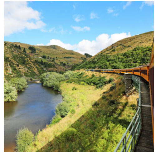
Zugfahrt mit der "Driving Creek Eisenbahn"

Heute fahren Sie weiter nach Süden, vorbei an der Wildnis des Kaimai Mamaku Forest Park und durch das fruchtbare Hinterland der Bay of Plenty. Sobald Sie den Lake Rotorua sehen können, haben Sie das heiße Herz der Nordinsel erreicht: aufregende Thermalgebiete umgeben den See, der aus der Caldera eines Vulkans entstanden ist. (F)