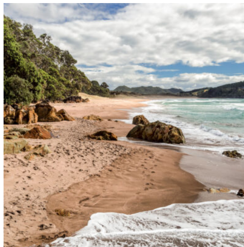
Hot Water Beach

Etwas vollkommen Anderes erwartet Sie im Anschluss in der Unterwelt der Waitomo Höhlen. Sie dringen bei einer Bootsfahrt tief ins Innere der Höhlen vor und sehen die Glühwürmchen, die die Höhlendecke in einen funkelnden Sternenhimmel verwandeln. Das Tagesziel ist die Universitätsstadt Hamilton, wo am Ende des Tages noch Zeit für einen erholsamen Spaziergang durch die Stadt ist. Vielleicht besuchen Sie hier ja den reizvollen Botanischen Garten. (F A)