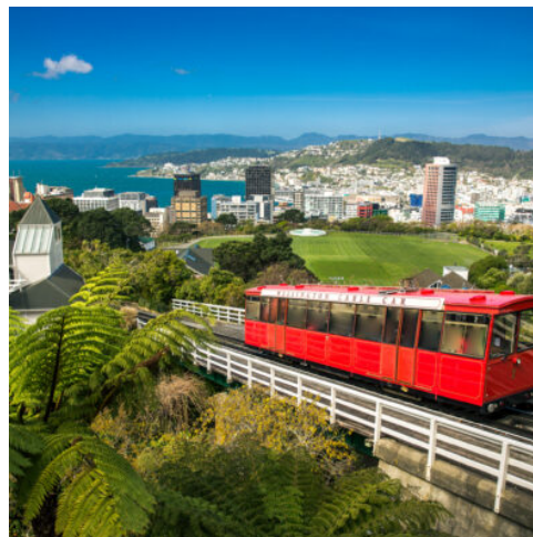
Cable Car in Wellington

Am Morgen fahren Sie zum Lake Tekapo und entdecken das Alpenpanorama mit Blick auf Neuseelands höchsten Berg, den Mount Cook. Wenn das Wetter es zulässt haben Sie (optional) die Chance auf einen Rundflug über die schneebedeckten Southern Alps (buchbar vor Ort). Weiterfahrt nach Twizel im Hochland des Mackenzie Countrys. (F A)