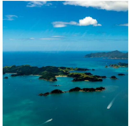
Bay of Islands

Machen Sie Halt in Taupo. An den Huka Falls stürzen jede Sekunde 200.000 Liter Wasser über die Vorderseite des Kliffs. Das Craters of the Moon, ein aktives Thermalgebiet, lädt zu einem entspannenden Spaziergang ein. (F)