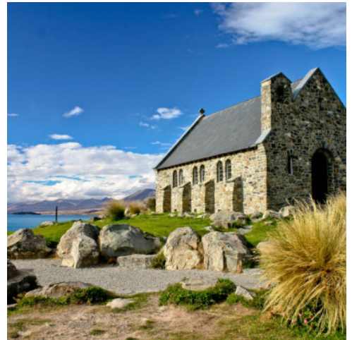
Church of the Good Shepherd am Lake Tekapo

Willkommen in Neuseeland. Nehmen Sie Ihren Mietwagen am Flughafen in Empfang und erkunden Sie das beschauliche Christchurch.