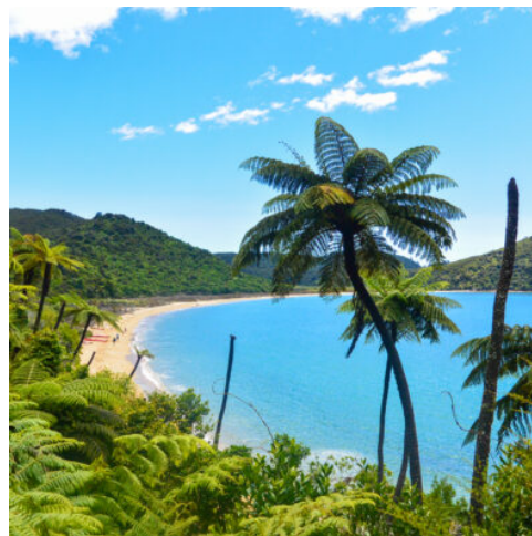
Abel Tasman National Park

Machen Sie auf Ihrer Fahrt nach Greymouth Halt in Hokitika, einer Hochburg der Jadegewinnung und -bearbeitung. Den Baumwipfelpfad südlich von Hokitika, Lake Mahinapua, sollten Sie unbedingt mitnehmen (optional zubuchbar). (F)