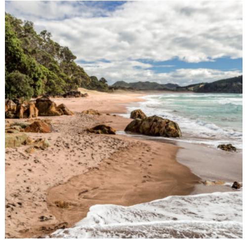
Hot Water Beach

Sie verlassen Wellington und fahren die Kapiti-Küste hinauf in das vulkanische Herz der Nordinsel zum Tongariro-Nationalpark. Er beherbergt drei aktive Vulkane, eingebettet in majestätische Landschaften. (F)