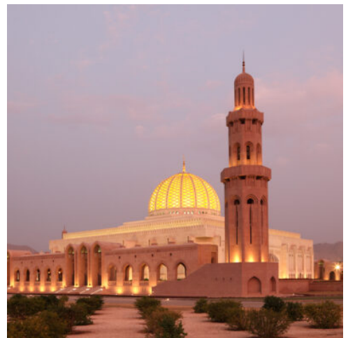
Muscat - Sultan Qaboos Moschee

Sie beginnen den Tag mit einer der wichtigsten Sehenswürdigkeiten Muscats, der Großen Sultan-Qabus-Moschee. Der mächtige Bau aus indischem Sandstein weiß nicht nur mit seiner schönen Architektur zu beeindrucken, sondern gewährt auch Nichtgläubigen Zutritt und bietet so einen einmaligen Einblick in die Welt des Islams (Kleiderordnung beachten). Ein prächtiger Swarovski Leuchter und ein riesiger handgeknüpfter persischer Teppich zieren die Hauptgebetshalle. Weiter geht es zum Muttrah Souq, einem traditionellen orientalischen Bazar. Lassen Sie sich von der lebhaften Atmosphäre und dem Duft von Weihrauch und Gewürzen verzaubern. Anschließend Besuch des Bait Al Zubair Museums in der Altstadt Muscats. Das private Museum ist bekannt für seine feine Kollektion an traditionellem Schmuck, Waffen und Kleidung. Mittagessen in einem lokalen Restaurant. Weiter geht es zu einem Fotostopp am Al Alam Palace, dem Palast des Sultans. Anschließend genießen Sie bei einer ca. 2-stündigen Bootsfahrt entlang der Küste Muscats den Sonnenuntergang. Auf dem Rückweg zum Hotel halten Sie für einen Foto-Stopp am Royal Opera House und fahren durch das Regierungs- und Botschaftsviertel. (F M)