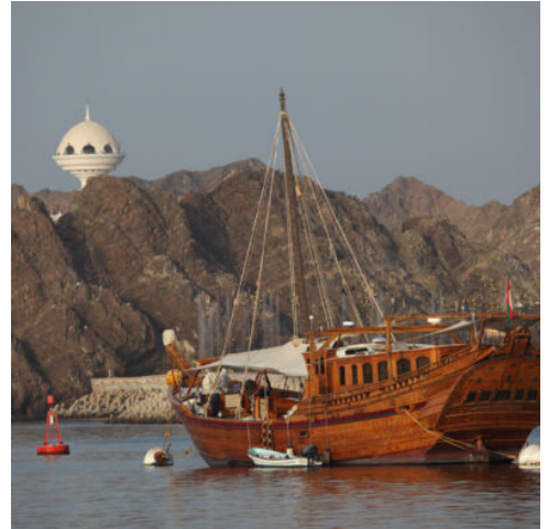
Schiff im Hafen von Muskat

Ankunft am Morgen. Am Flughafen werden Sie bereits erwartet und zu Ihrem Hotel in Muscat gebracht (ab Nachmittag Zimmerbezug, vorher gegen Aufpreis möglich). Erholen Sie sich von Ihrer Anreise bevor sie die Möglichkeit haben in der nahe gelegenen Shopping-Mall auf eigene Faust einen ersten Einblick in den omanischen Alltag zu erleben. Zahlreiche Geschäfte und Boutiquen laden zum Einkaufserlebnis ein. Abendessen im Hotel. (A)