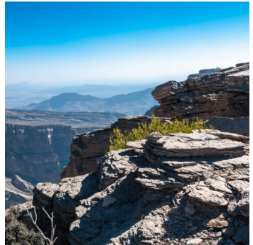
Jebel Shams Gebirge

Sanddünen erheben sich wie Wellen im Meer, die Sonne flimmert golden über dem Sand. Die heutige Nacht verbringen Sie in einem Wüstencamp inmitten der Natur. Es erwartet Sie eine Nacht unter dem beeindruckenden Sternenhimmel der Wüste. Davor genießen Sie bei einem Grillabendessen arabische Köstlichkeiten. (F M A)