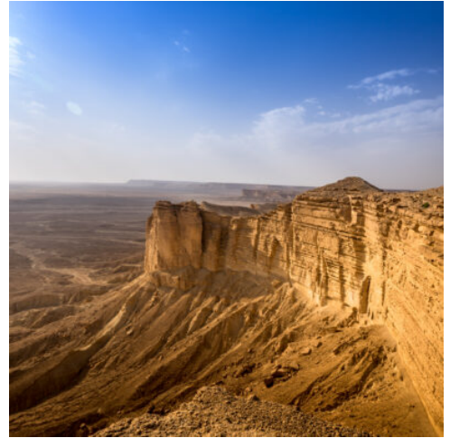
Edge of the World

Ihre Entdeckung des Erbes von Al Ula beginnt mit der Besichtigung von Hegra (nicht exkl., zusammen mit anderen Teilnehmern), Saudi-Arabiens bedeutendste kulturelle Attraktion. Die kunstvoll in den Felsen geschlagenen Monumentalgräber sind beeindruckende Zeugnisse der Zeit. Dieses UNESCO-Weltkulturerbe wurde vor 2.000 Jahren von den nabatäischen Arabern erbaut und war seit ihrer Errichtung bis zur Entdeckung im Jahr 1876 für die Welt „verschollen“. Anschließend Rundgang durch die archäologische Stätte Dadan, mit den berühmten Löwengräbern. Das antike Königreich Dadan war eine der am weitesten entwickelten Städte der Arabischen Halbinsel im 1. Jahrtausend v. Chr. Dieser Ort war die Hauptstadt der dadanitischen und dann der lihyanitischen Königreiche und eines der wichtigsten Zentren des Karawanenhandels. Weiter geht es nach Jabal Ikmah. Diese in einem atemberaubenden Wüstencanyon gelegene "Bibliothek unter freiem Himmel" beherbergt die beeindruckendste Sammlung von Inschriften, Felszeichnungen und Petroglyphen in Al-Ula und ist die größte ihrer Art in Saudi-Arabien. Der Tag in Al Ula endet mit der Besichtigung des imposanten Elephant Rock beim Sonnenuntergang. (F A)