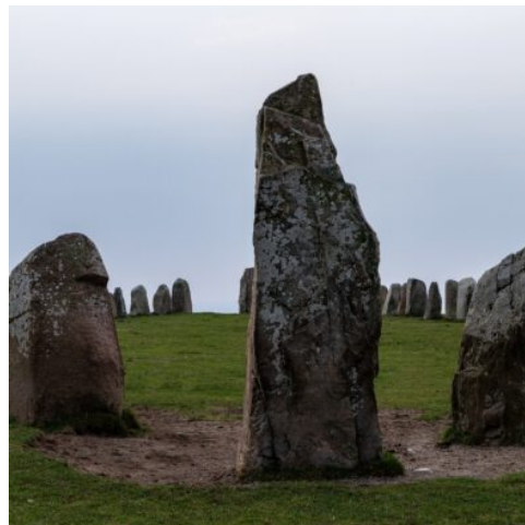
Die Steine von Ale

Sie fahren heute in die Metropole Göteborg, welche Sie auf einer 2-stündigen Stadtführung erleben. Schwedens zweitgrößte Stadt wurde 1621 von König Gustav II. Adolf gegründet und wuchs schnell zum Zentrum des kommerziellen Fischfangs und des Schiffbaus. Später spielte es eine führende Rolle in der innovativen Automobilindustrie, denn Göteborg ist die Heimat von Volvo. Sie sehen u.a. die bekannte Fischhalle, die Prachtstraße Avenyn und das gemütliche Künstlerviertel Haga. Im Zentrum finden Sie zahlreiche kleine befahrbare Kanäle und alte Bauwerke aus längst vergangener Zeit. Danach fahren Sie zu dem lieblichen Schloss Läckö, das bekannte Barockschloss des Grafen Magnus Gabriel de la Gardie am Ufer des Vårsees. Danach fahren Sie zum Hotel in Örebro. (F)